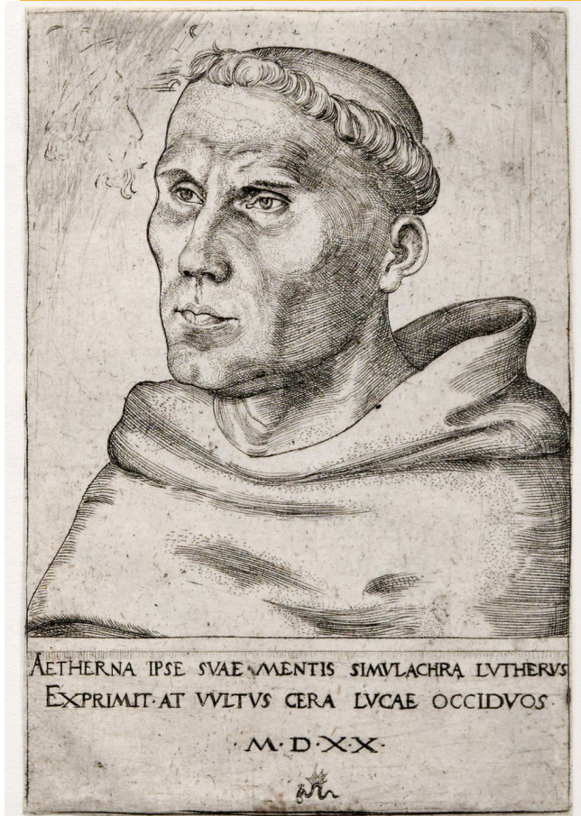
Luther, Zeichnung von Cranach d. Ä. 1520