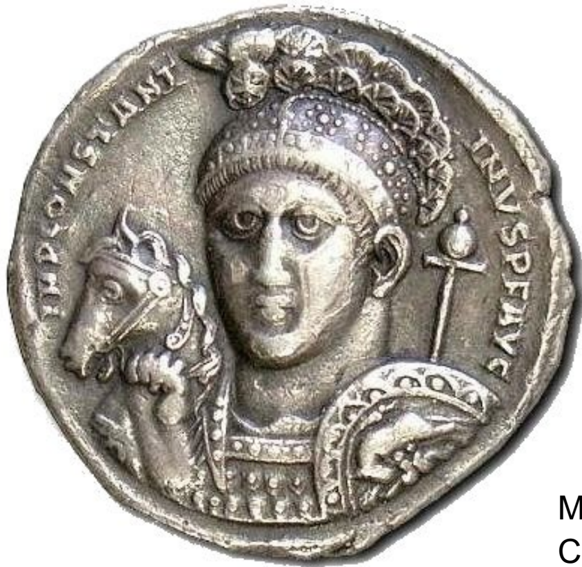
Münzdarstellung Kaiser Konstantins mit Christusmonogramm am Helm