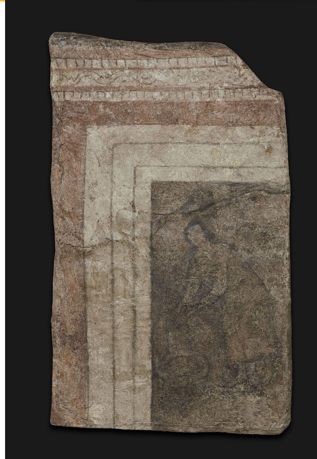
Wandmalerei aus der Hauskirche von Dura Europos